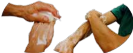
Savonner mains et avant-bras, coudes inclus, sans frotter