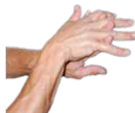
Appliquer de la crème protectrice sur le dos des mains puis la répartir sur toute la main.

Zones de la main fréquemment oubliées lors de la procédure de désinfection !