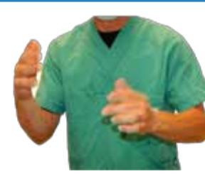
Attendre le séchage spontané à l'air avant d'enfiler les gants ! Ne pas secouer les mains !