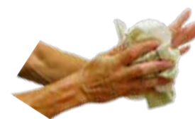
Essuyer les mains et les bras par tamponnement à l'aide d'essuie-mains en papier