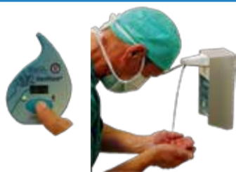
Appliquer le PHA sur les mains et avant-bras. Respecter un temps de friction de 1,5 minute (horloge)* !

C'est l'étape de désinfection chirurgicale par friction. Garder les mains et avant-bras mouillés durant 1,5 minute*