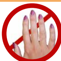
Pas d'ongles artificiels ni vernis, ni résine