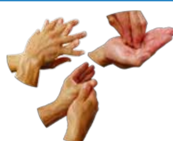
Se concentrer sur les zones souvent oubliées