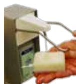
Utiliser du savon et une éponge sèche

C'est une procédure de lavage simple des mains. A réaliser avant la première chirurgie de la journée ou quand les mains sont visiblement souillées.