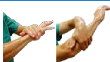
Bien répartir le produit sur les mains, avant-bras et coudes, ainsi que les bras lors de chirurgie abdominale