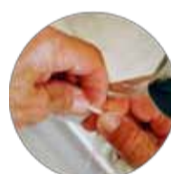
Cureter et brosser les ongles, se rincer à l'eau courante